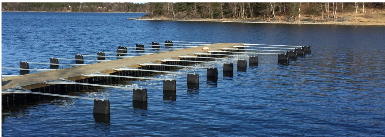
Föreningsbrygga 2,4x42,5 m med 4,5 och 6 m MFB-bommar.

MH-bryggorna är speciellt lämpliga på grunda platser då de endast ligger ca 15 cm djupt och tål även att stå på botten vid lågvatten (om den inte står på vassa stena).