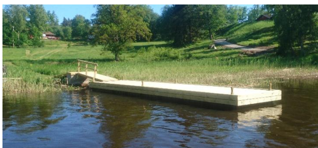
Träinklädd MH-brygga 2,4

ML-bryggorna förankras med galvade stålrör som trycks ned i botten eller med kätting och betongvikter eller P-ringar.