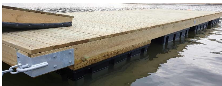
Privatbrygga 2,4x6,6 m.

ML-bryggorna förankras med galvade stålrör som trycks ned i botten eller med kätting och betongvikter eller P-ringar.